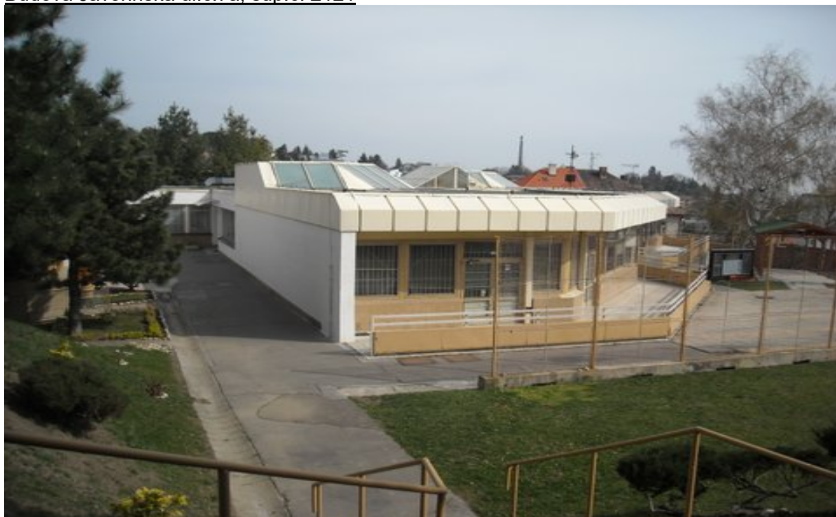
Budova Javorinska ul.č.7a, súp.č. 2121